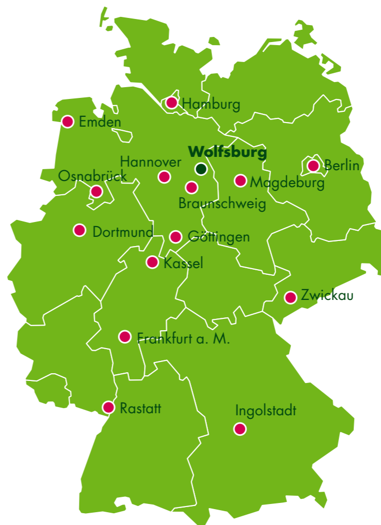
Unsere 14 Niederlassungen finden Sie überall in Deutschland. Weitere Informationen unter: www.autovision-gmbh.com

Die AutoVision ist immer in Bewegung. Unser Dienstleistungsportfolio ist heute bereits eines der umfangreichsten am Markt. Dennoch stellen wir uns täglich den Herausforderungen der Märkte und den Bedürfnissen unserer Kunden. Wir integrieren geeignete Softwarelösungen, um unsere Prozesse mit Hilfe modernster Technologien schneller und transparenter zu gestalten. Davon profitieren Sie mehrfach: erstens durch eine hohe Effizienz, zweitens durch Transparenz, drittens durch eine exzellente Qualität und viertens durch eine Full-Service-Beratung und -Betreuung. Diese Kombination bietet Ihnen neben der AutoVision kaum jemand. Für über 180 Kunden sind wir bereits Partner des Erfolgs. Gern auch für Sie. Wir freuen uns auf ein Gespräch überall in Deutschland und immer öfter auch in Europa.